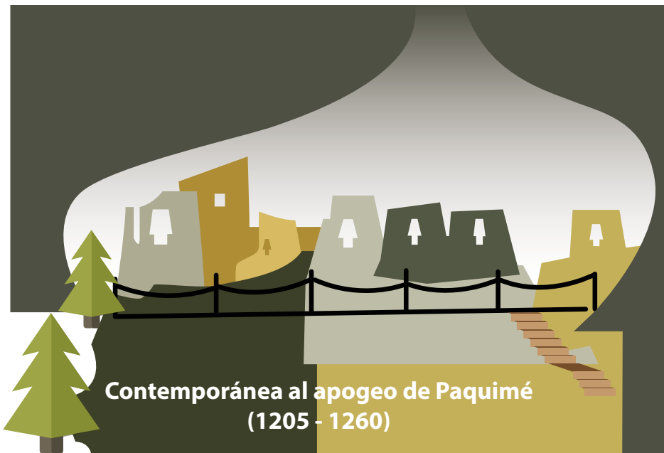
Contemporánea al apogeo de Paquimé (1205 - 1260)